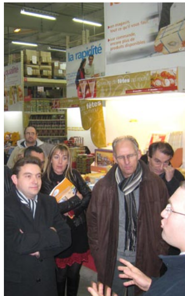
Visite de l'entreprise Promocash