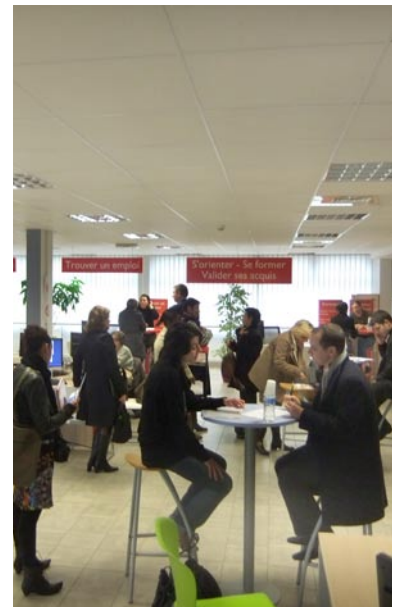
Atelier recrutement "5 min pour convaincre"