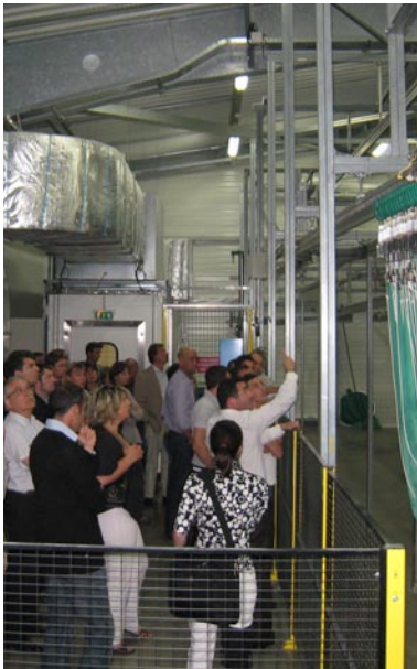
Visite de la Blanchisserie de l'hôpital

L'intégration des entreprises récemment implantées constitue également l'une des missions du club. Les relations «interclubs» se développent à travers des rencontres régulières et des manifestations communes.