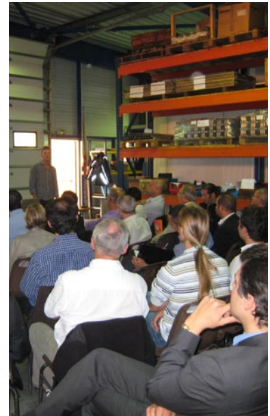
Visite de la société Atlantique Production