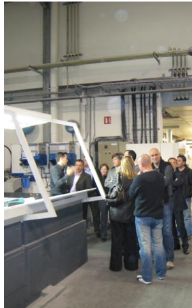
Visite de l'Imprimerie Rochelaise