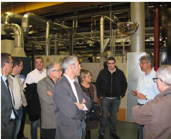
Visite de la société DELPHI Diesel System