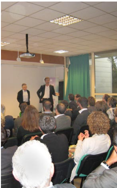
Visite du Groupe LEA Nature