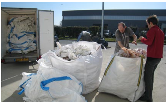
Plus d'1 tonne de Big Bags affectés au ré-emploi chez OVIVE

La dernière phase aura pour mission de pérenniser le projet et de le développer en accompagnant les autres zones d'activités sur la démarche.