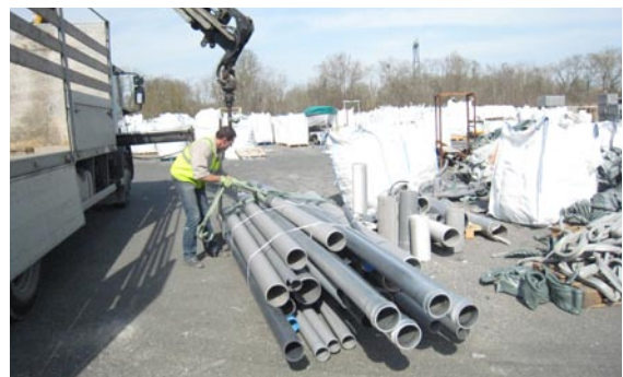
200kg de PVC récupérés et retraités sur la ZI par la Si 6 PERIPLAST